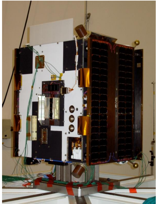
Figuur 2 LYRA en SWAP zijn op de satelliet geïntegreerd. De 3 cirkels zijn de 3 'ogen' van LYRA. In de rechthoekige opening eronder zit SWAP.

LYRA is gevoelig voor kleine veranderingen in de zonnestraling en kan bovendien 100 metingen per seconde uitvoeren. Dit is belangrijk tijdens een zonneminimum wanneer het UV-stralingsniveau beduidend lager is in vergelijking met een maximum. Momenteel zit de Zon in zo een minimum. De gegevens die we tot nu toe gebruiken in het ruimteweersvoorspellingencentrum verbonden aan de Koninklijke Sterrenwacht van België, komen van instrumenten die de X-straling waarnemen in een zeer nauw golflengte-interval. Tijdens een minimum registreren deze instrumenten geen straling omdat ze simpelweg niet gevoelig genoeg zijn. LYRA kan omdat het gebruik maakt van een breed interval in het UV spectrum toch nog de variaties in het stralingsniveau in kaart brengen. Bovendien kan LYRA ook zeer kortstondige lichtflitsen registreren dankzij de hoge tijdsresolutie.