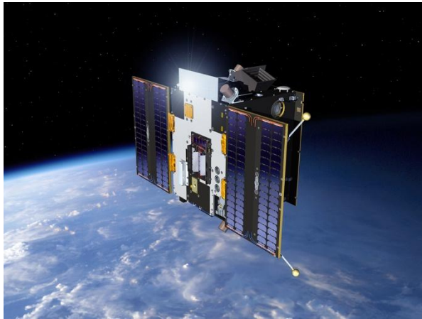
Figuur 1 Impressie van PROBA2 in een baan rond de Aarde kijkend naar de Zon.

2 november 2009 is een hoogdag voor de Belgische ruimtevaart en ruimtewetenschappen: PROBA2 wordt om 02:50 Belgische tijd de ruimte in geschoten vanuit de Russische lanceerbasis Plesetsk. Met PROBA2 hebben we een primeur: het is de eerste ESA satelliet die de Zon observeert om zo ondersteuning voor de zogenaamde 'ruimteweersvoorspellingen' te bieden. En bovendien, PROBA2 werd in België gebouwd.